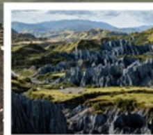
สวนหินป่าเหม่ย