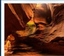
แกรนด์แคนยอนยูดาโกว