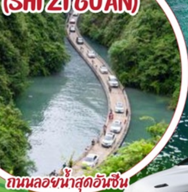
ถนนล่องน้ำสุดอันซีน