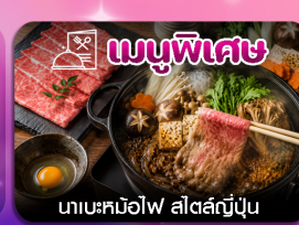
เมนูพิเศษ นาเบะคินอิโง สัตสึเมะนิ่ม

ชิบโปโร-อาซาฮิกาว่า-ลานสกีซึกิไซ-คลองโอตารุ-โรงงานช็อกโกแลต-หมู่บ้านเทพนิยาย-ช้อปปิ้งทากุจิโคจิ-อีสะะเต็มวัน