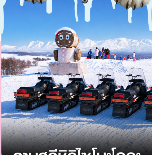
ลานสกีซึกิไซโนะโอกะ