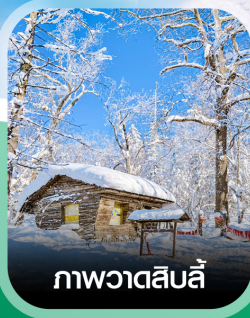
ภาพวาดสีบลู