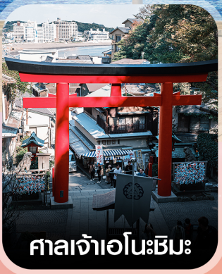
ศาลเจ้าเอโนะชิมะ