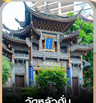
วัดหลิวอัน