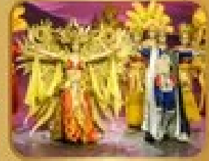
ชมการแสดงโขน