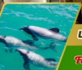
ล่องเรือชมโลมา