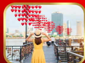
เชิควินสะพานแห่งความรัก