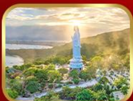
หอพระกวนอิม วัดหลินอึ้ง