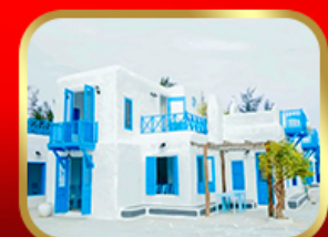
คาเฟ่ Son Tra Marina