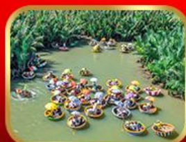
ล่องเรือกระดิ่งกั๊กทาน