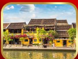
เที่ยวเมืองเก่าฮอยอัน