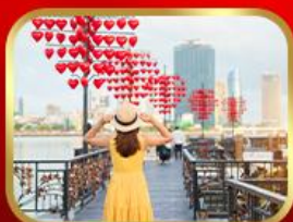
เช็กอินสะพานแห่งความรัก