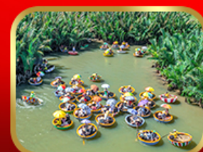
ล่องเรือกระดิ่งกั๊กทาน