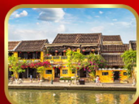
เที่ยวเมืองเก่าฮอยอัน