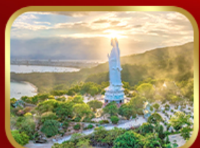
ขอพรกวณอิมวัดหลินอึ้ง