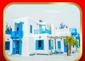
คาเฟ่ Son Tra Marina