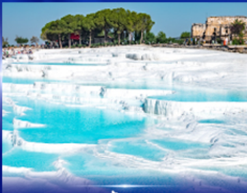
ปราสาทบุษบ้าย น้ำพุคคาเอ