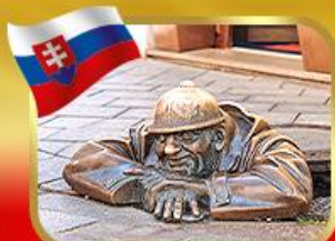
เช็คอินคู่คูมิลเมืองบาตีสลาวา