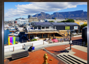
ท่าเรือ V&A waterfront