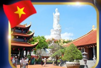
ชมพระอัครกษัตริย์ วัดโพนก๊วก