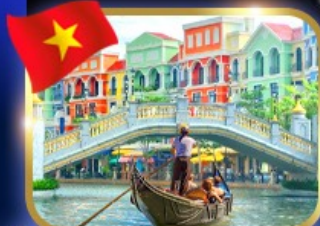
เวนิสจำลอง แกรนด์ เวิลด์