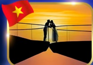
เช็คนิสุดหวาน สะพานรูป