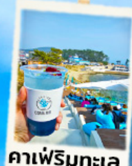
คาเฟ่ริมทะเล