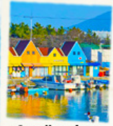
ท่าเรือสีสัน