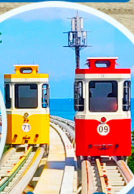
นั่งรถไฟปู๊กบีก

ราคานี้รวมค่าภาษีน้ำมัน + ค่าภาษีสนามบิน ** ปรับขึ้น ณ วันที่ 1 เม.ย. 69 เรียบร้อยแล้ว **