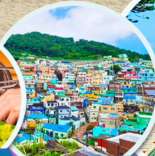
หมู่บ้านคัมซอน