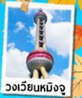
วงเวียนหมิงจู่