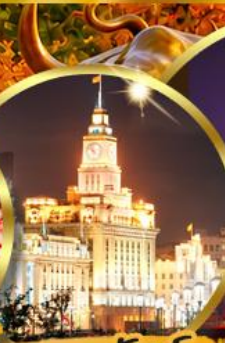
เดอะมันด์