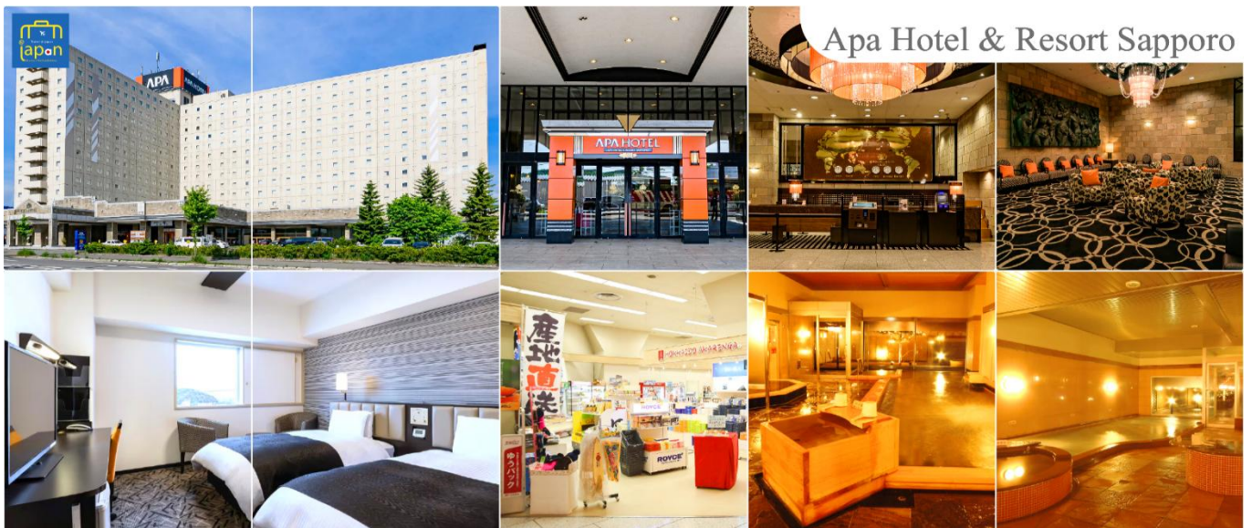
Apa Hotel & Resort Sapporo

--ให้ท่านได้ผ่อนคลายกับการแช่น้ำแร่ธรรมชาติ ออนเซน เชื่อว่าถ้าได้แช่น้ำแร่แล้ว จะทำให้ผิวพรรณสวยงามและช่วยให้ระบบหมุนเวียนโลหิตดีขึ้น--