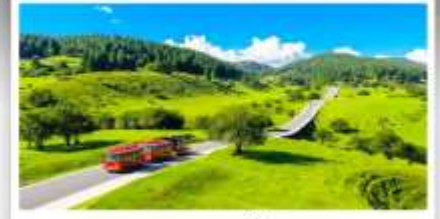
เหนางฟ้า

เดินทางโดย: สายการบินฉงฉิ่งเจียงเป่ย์ (PN)