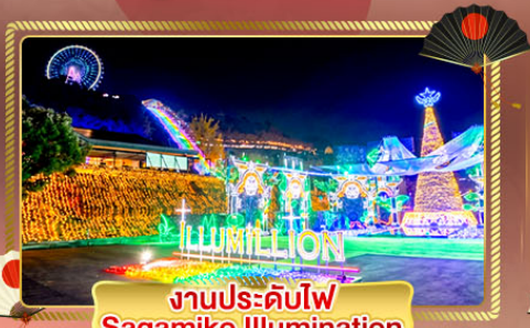
งานประดับไฟ Sagamiko Illumination