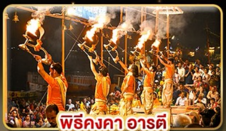
พิธีคองคา อารตี