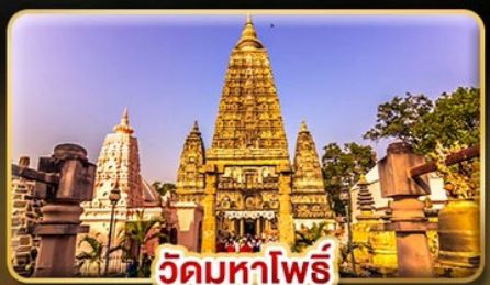
วัดมหาโพธิ์