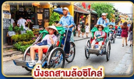
นั่งรถสามล้อฮิโคล่