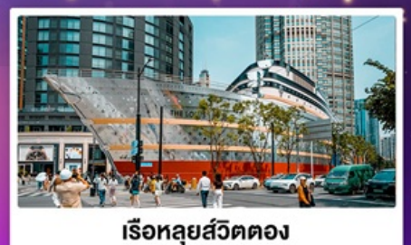
เรือทูลุยส์วัดตอง