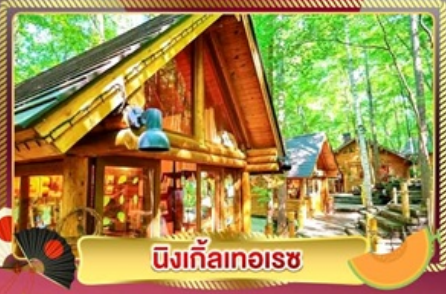
นิงเกิ้ลทอเรซ

ชมทุ่งลาเวนเดอร์ และทุ่งดอกไม้ขึ้นชื่อของฮอกไกโด ฟาร์มโทมิตะ และ ชิโกะไซโนะโอะกะ