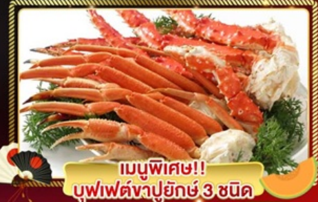
เมนูพิเศษ!! บุฟเฟ่ต์ขาปูยักษ์ 3 ชนิด