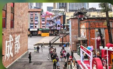
ตงเจียวจ้ออ๋อ