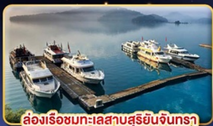
ล่องเรือชมทะเลสาบสุริยจันทร