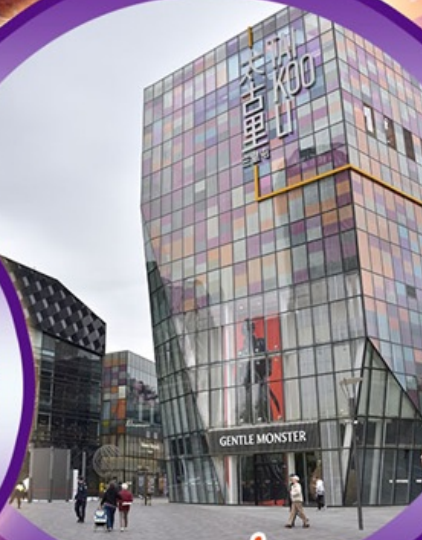
ชานหลี่กุน