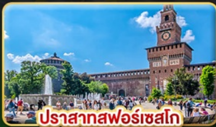
ปราสาทฟอรัสโก