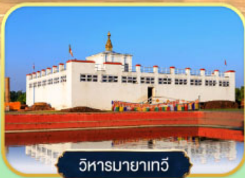
วิหารมายาเทวี