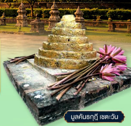
มุลคินรฤฎี เขต-วัน