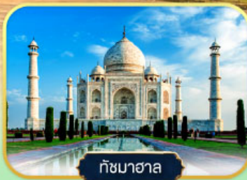
ทัชมาฮาล