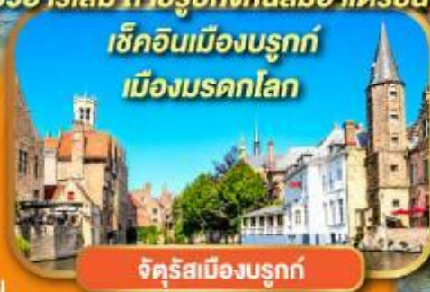
เช็किनเมืองบรุคก์ เมืองมรดกโลก