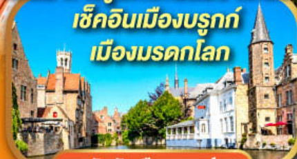
จัตุรัสเมืองบรูคซ์