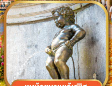
หนูน้อยมานกันพิส