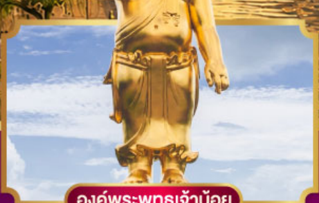
องค์พระพุทธรูปเจ้าน้อย