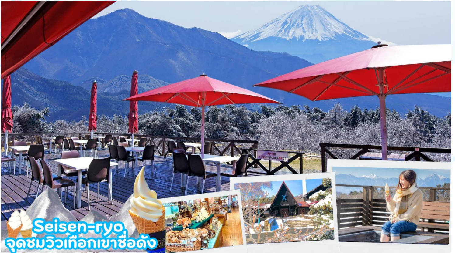
Seisen-ryo จุดชมวิวเทือกเขาฮ็อคโต

เมืองโฮคุโตะ (Hokuto) ตั้งอยู่ทางตะวันตกเฉียงเหนือของจังหวัดยามานาชิ เป็นเมืองที่ล้อมรอบไปด้วยภูเขาสูง เช่น ภูเขาýtตสึงาตาเกะ เทือกเขาแอลป์ตอนใต้ ภูเขาคินปู และภูเขาคายะงาตาเกะนอกจากนั้น ยังสามารถเห็นวิวที่สวยงามของภูเขาไฟฟูจิได้อีกด้วยมีทรัพยากรธรรมชาติที่มีคุณภาพ ไม่ว่าจะเป็น น้ำแร่ เมล็ดข้าว และผลิตภัณฑ์จากนมวัว