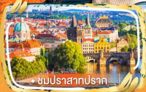
• ชมปราสาทปราก