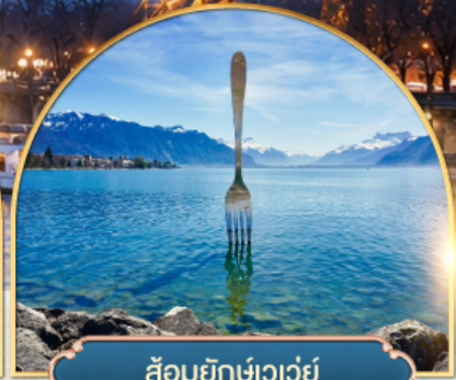
ล้อมยักซ์เวอว์