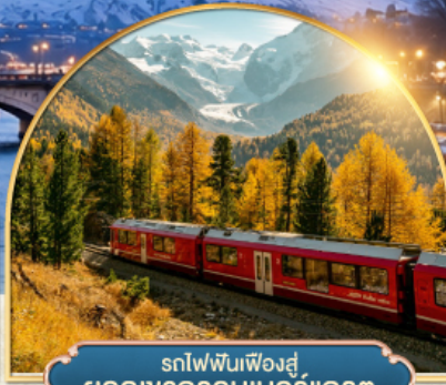
รถไฟฟันเฟืองสู่ยอดเขากรอนเนอส์เกรต