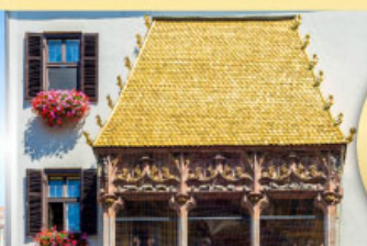
หลังคาทองคำอินน์สบรุค