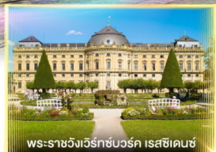
พระราชวังแวร์ซายส์ นครปารีส