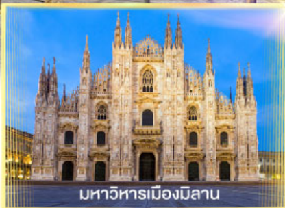
มหาวิหารเมืองมิลาโน