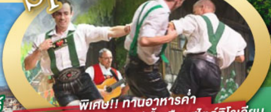
พิเศษ!! ทานอาหารค่ำ พร้อมชมการแสดงดนตรีพื้นเมืองสไตล์โรเลียน และเยือนเมืองอูเทรคต์ สีสันใหม่เบียร์แลนด์

ไฮไลท์ในโปรแกรม • เยือนเมืองแห่งแคว้นบาวาเรีย และ ทิโรล • สุกสนานเหมืองเกลือเบียร์เทสกาเดิน • เข้าชมปราสาทนอยชวานสไตน์ • เดินเล่นจัตุรัสโรเมอร์ ซอปปิง Zeil Street • ถ่ายรูปมุมสวยของหมู่บ้านอัลสติก • ซิลลา ไปในเมืองซาลสบูร์ก บ้านเกิดโมสาร์ท 25 ก.ย. - 04 ต.ค. 69 • ล่องเรือหมู่บ้านทีธูร์น และ ล่องเรือชมนครอัมสเตอร์ดัม 09-18, 16-25 ต.ค. 69 • ซอปปิงจุใจย่านดิมสแควร์และเดินเล่นย่านโคมแดง 22-31 ต.ค. 69 / 06-15 พ.ย. 69 29 ธ.ค. 69 - 07 ม.ค. 70 * ปีใหม่ *