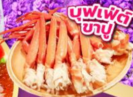
บุฟเฟ่ต์ ซาบู่