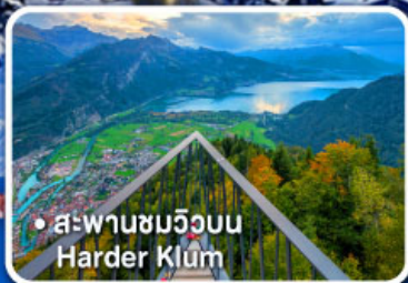
• สะพานชมวิวนบน Harder Klum