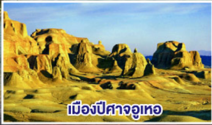
เมืองปีศาจจวูเทอ