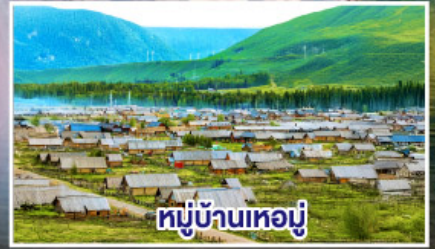
หมู่บ้านเหมอู๋