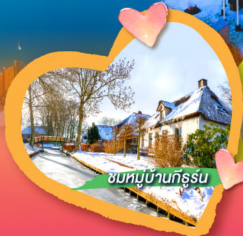
ชมหมู่บ้านกิธูร์น