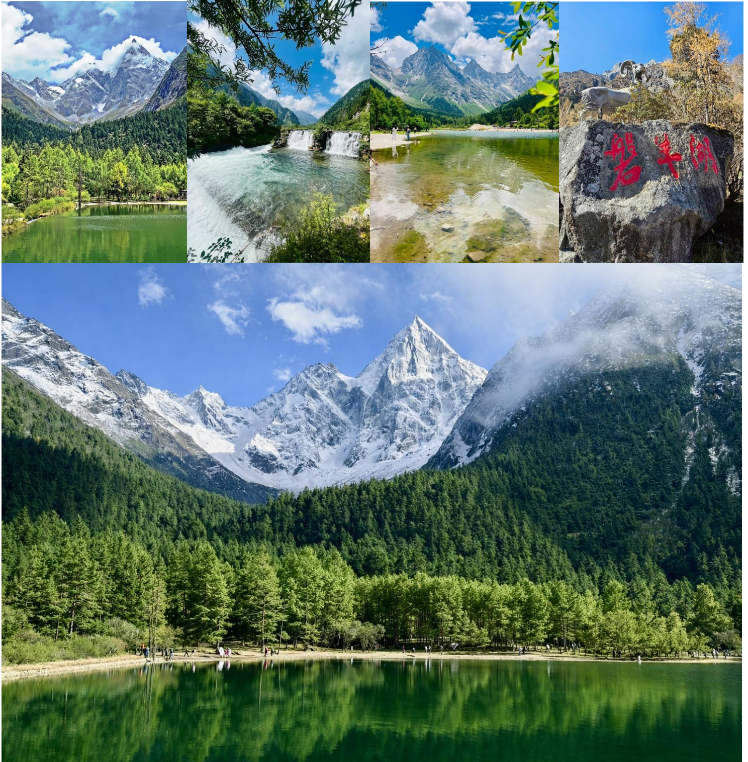
GO1TFU-SL020 เฉิงตู ฉงชิ่ง มรดกโลกพระหินแกะสลักตำจู้ อุทยานหลุมบ่อฟ้า อุทยานเขานางฟ้า อุทยานภูเขาสี่ตระกูล อุทยานปีเฟิงโกว (นั่งรถไฟความเร็วสูง) *ไม่ลงร้านช้อปปิ้ง* 7วัน 6คืน โดยสายการบิน Thai Lion Air (SL)

เช้า รับประทานอาหารเช้า ณ ห้องอาหารภายในโรงแรม (มื้อที่ 13)