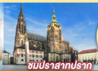
ชมปราสาทปราก