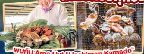
พบกับ Ama Hut "Haohiman Kamado" เมนูพิเศษ SEAFOOD

AirAsia สายการบิน AirAsia X (XJ) น้ำหนักกระเป๋า 20 KG