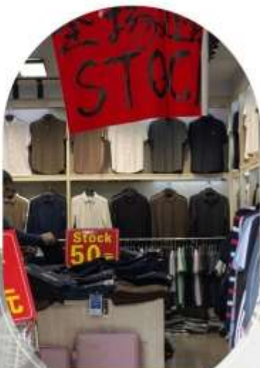
ตลาดค้าส่งอู่