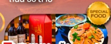
พิเศษเมนู สุกี้ปลาเซลม่อน ลิ้มรสไวน์แดงชื่อดัง เดินทาง ต.ค. 69 เป็นต้นไป