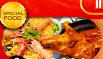
ข้าวผัด + หมูหันสไตล์สเปน