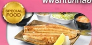
Hokke Set เซตข้าวปลาชอกเกะ