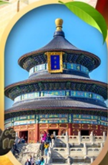
หอสังเกตการณ์เทียนถาน