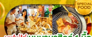
บุฟเฟ่ต์ บันบานาฮิลล์ 1 มื้อ และ บุฟเฟ่ต์ บาบิวบึงย่าง เดินทาง มี.ค. - ต.ค. 69