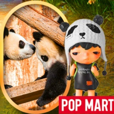
ศูนย์อนุรักษ์หมีแพนด้า POP MART

เจิงตู ปี้ผิงโกว จิ้งจ้ายโกว หมีแพนด้าตัวเป็นๆ